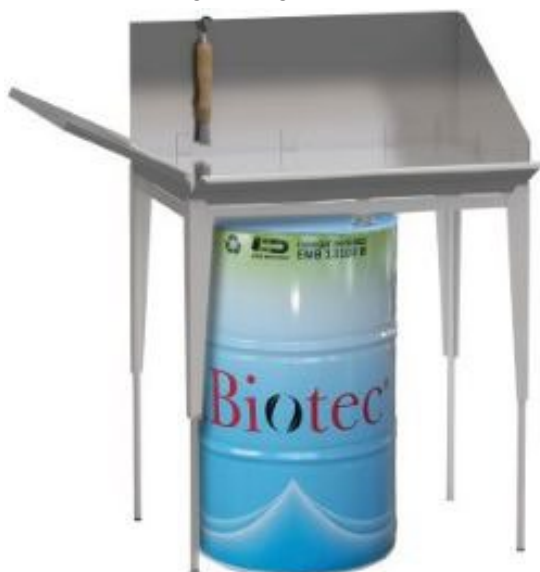
Fontaines à solvants