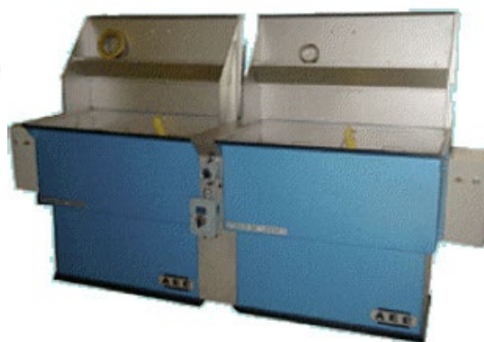
Bacs pour immersion à froid ou à chaud

iBiotec® Tec Industries® Service Z.I La Massane - 13210 Saint-Rémy de Provence – France Tél. +33(0)4 90 92 74 70 – Fax. +33 (0)4 90 92 32 32 www.ibiotec.fr